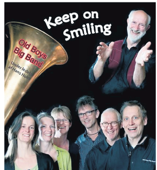
Old Boys Big Band er klar med deres tredje cd med den passende titel »Keep On Smiling«

Old Boys Big Band: »Keep On Smiling« (cd, egen udgivelse, spilletid ca. 55 minutter)